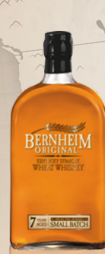
美國伯漢肯塔基威士忌 45% 0.75L