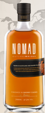
Nomad 雪莉雙桶威士忌 41.3% 0.7L