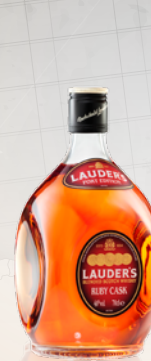
英國勞德 Ruby Cask 波特桶蘇格蘭威士忌 0.7L