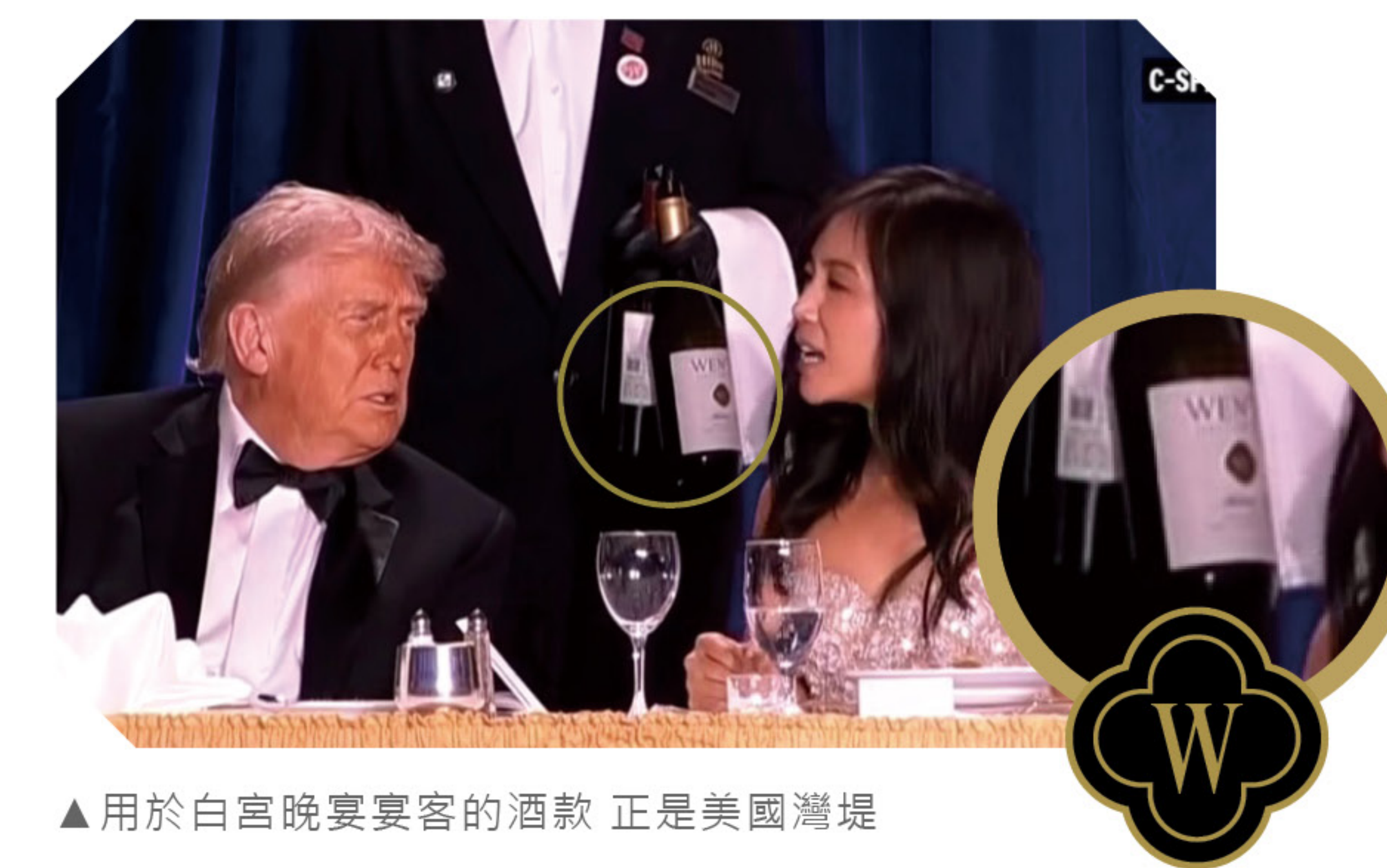
▲用於白宮晚宴宴客的酒款 正是美國灣堤

酒莊透過不同品種與產區的搭配，打造兼具層次與平衡的酒款，除了釀酒實力備受肯定外，灣堤酒莊近年亦獲得國際酒評高度評價。2022 Morning Fog Chardonnay 入選《Wine Spectator》2024 年度 Top 100 第 40 名；2021 Wetmore Cabernet Sauvignon 則獲《Wine Enthusiast》94 分評價，並入選 2024 年度全球百大最受矚目酒款之一。