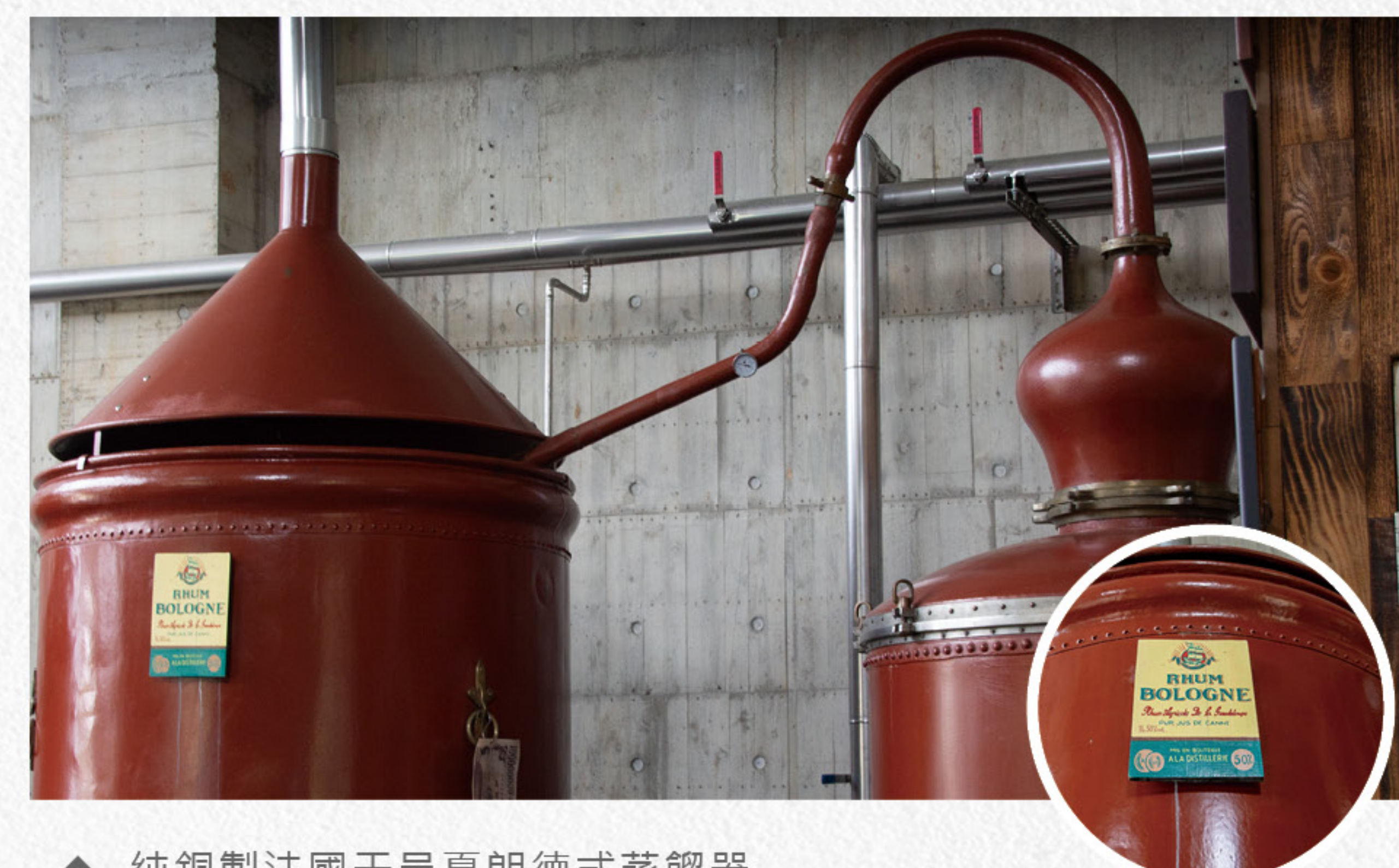
▲ 純銅製法國干邑夏朗德式蒸餾器

為了追求極致的品質，神跡酒造導入了「預防性釀酒哲學」，建立完全依循自然引力的四層樓重力流（Gravity Flow）建築。酒廠拒絕使用機械泵浦過度干預酒液，由上至下落實榨汁、沉澱、發酵與裝瓶，讓酒水順應重力流動、自然熟成，徹底避免幫浦抽取時產生的熱能破壞細緻的風味。